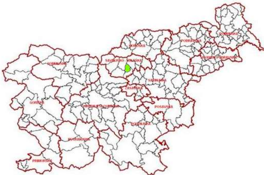
Slika 2: Umestitev Občine Rečica ob Savinji v Sloveniji