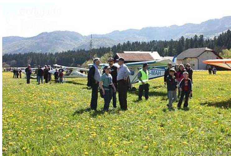
Slika 1: Vzletišče Pobrežje

Vzletišče Pobrežje se uporablja za dnevno letenje, vsi pristanki pa se izvajajo na lastno odgovornost uporabnikov.